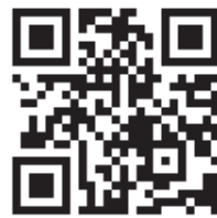
Юридическая консультация ФНПР

Юридическая консультация ФНПР: +7 (495) 938-84-39 Единый контакт-центр Роструда: 8 800 6-000-000