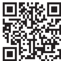
Программа ФНПР принята X съездом